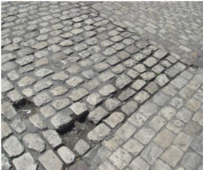
PAVIMENTO Y ACCESOS