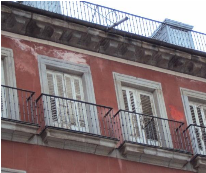
FACHADAS Y CUBIERTAS